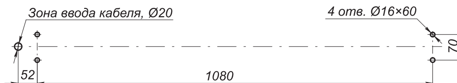
Разметка отверстий для монтажа калитки

На рисунке показана разметка отверстий для монтажа калитки. Для прокладки кабеля управления к замку в стойке рамы калитки предусмотрено отверстие.